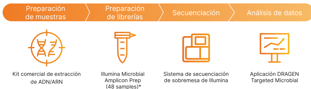
Figura 2: Flujo de trabajo de Illumina Microbial Amplicon Prep: en un flujo de trabajo optimizado, las librerías microbianas se preparan con el kit Illumina Microbial Amplicon Prep, se secuencian en cualquier sistema de secuenciación de sobremesa de Illumina y se analizan en la aplicación DRAGEN Targeted Microbial para la detección, la llamada de variantes y la tipificación de estirpes. *El kit incluye índices para la preparación de librerías. Los oligonucleótidos del cebador se adquieren por separado.