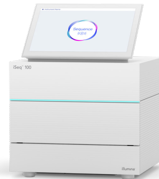
Figura 1: iSeq 100 System. Aproveche la potencia de la secuenciación de nueva generación (NGS, next-generation sequencing) en el sistema de secuenciación de sobremesa más compacto y asequible de la gama de soluciones de Illumina.