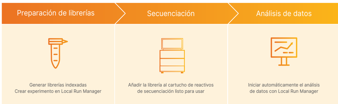
Figura 2: iSeq 100 System forma parte de un flujo de trabajo optimizado de ADN a datos.

iSeq 100 System forma parte de un flujo de trabajo optimizado en tres pasos que incluye la preparación de librerías, la secuenciación y el análisis de los datos (figura 2).