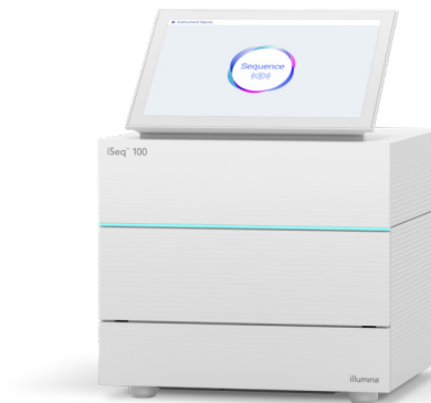
Figure 1 : Le système iSeq 100 – Il tire parti de la puissance du séquençage de nouvelle génération (SNG) dans le système de séquençage de paillasse le plus abordable et compact de la gamme de produits d'Illumina.

Le système iSeq 100 s'intègre dans un flux de travail rationalisé en trois étapes qui comprend la préparation des bibliothèques, le séquençage et l'analyse des données (figure 2).