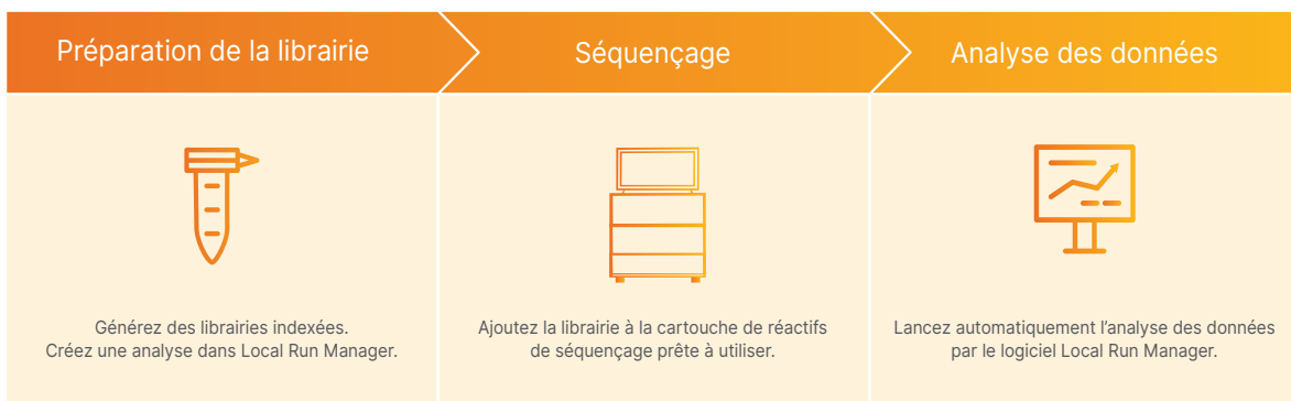
Figure 2 : Le système iSeq 100 s'intègre dans un flux de travail rationalisé, de l'ADN aux données.

Le système iSeq 100 est compatible avec toute la gamme des trousse de préparation de bibliothèques d'Illumina. Avec les trousse de préparation de bibliothèques d'ADN Nextera MC XT et Illumina DNA Prep, les chercheurs peuvent préparer des bibliothèques multiplexées en 3 ou 4 heures pour le séquençage de petits génomes ou le séquençage direct de longs amplicons. De plus, AmpliSeq MC for Illumina Targeted Resequencing Solution offre du contenu conçu par des spécialistes et présenté sous forme de panels fixes prêts à l'utilisation, de panels conçus par la communauté scientifique ou de panels personnalisés répondant à des besoins précis pour la recherche. Selon la version choisie, les trousse de préparation de bibliothèques d'Illumina peuvent ne nécessiter que 1 ng d'ADN ou d'ARN (ADNc) d'entrée et prendre en charge l'ADN extrait d'échantillons fixés au formol et inclus en paraffine (FFIP), tels que des tissus tumoraux préservés.