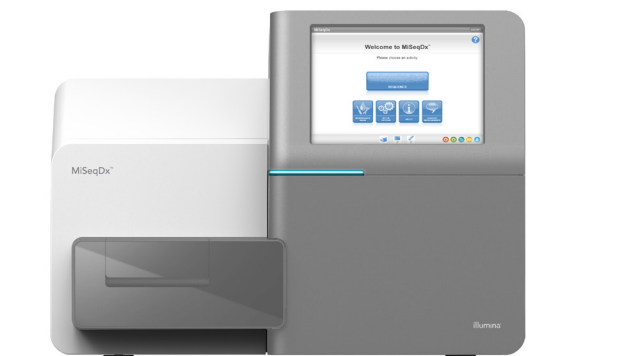
Figura 1: MiSeqDx Instrument. MiSeqDx Instrument, autorizado por la FDA y con certificación CE-IVD, ofrece un flujo de trabajo sencillo, una interfaz de software intuitiva y una mayor seguridad para los usuarios.

MiSeqDx Instrument es el primer instrumento diseñado para la secuenciación de nueva generación (NGS, next-generation sequencing) (figura 1) autorizado por la Administración de Alimentos y Medicamentos (FDA, Food and Drug Administration) de EE. UU. y con certificación de Conformidad Europea para diagnóstico in vitro (CE-IVD). MiSeqDx Instrument, diseñado específicamente para entornos de laboratorio clínico, ocupa poco espacio (0,3 metros cuadrados) y aporta un flujo de trabajo fácil de seguir, así como un resultado de datos adaptado a las diversas necesidades de los laboratorios clínicos. Además, el software integrado en el instrumento permite configurar experimentos, realizar el seguimiento de las muestras, gestionar usuarios, generar registros de auditoría e interpretar los resultados.* Gracias al aprovechamiento de la química de secuenciación por síntesis (SBS, sequencing by synthesis) demostrada de Illumina, MiSeqDx Instrument proporciona un cribado y unas pruebas diagnósticas exactas y fiables.