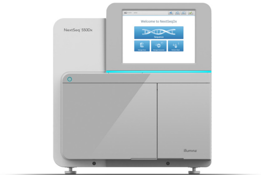
Figure 1 : L'instrument NextSeq 550Dx – en tirant parti des dernières avancées de la chimie de séquençage par synthèse et de flux de travail conviviaux et réglementés, l'instrument NextSeq 550Dx fournit des résultats de grande qualité tant pour les applications cliniques que pour les applications de recherche.

La chimie SBS d'Illumina exploite la compétition naturelle entre les quatre nucléotides marqués, ce qui réduit le biais lié à l'incorporation et permet un séquençage plus robuste des régions répétitives et des homopolymères 2 .