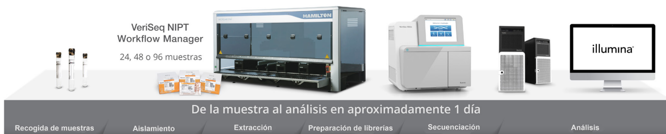
Figura 1: Flujo de trabajo completo de las NIPT de DIV. VeriSeq NIPT Solution v2 le ofrece todo lo que necesita para las NIPT con tecnología de NGS, incluidos los reactivos para la extracción de ADN, la secuenciación y preparación de librerías; la instrumentación para la secuenciación y preparación de librerías automatizadas con un software gestor del flujo de trabajo; un servidor in situ para un análisis y almacenamiento seguros de los datos, así como el software de análisis de datos con capacidad de generación de informes con resultados cualitativos.

VeriSeq NIPT Solution v2 se ha validado para determinar su fiabilidad y precisión clínicas. Se realizó un estudio de validación clínica con muestras procedentes de embarazos afectados que fueron aptas para su análisis siempre que hubiera resultados clínicos disponibles y que se cumplieran los criterios de inclusión de la muestra. La cohorte comprendía edades gestacionales de 10 semanas como mínimo, muestras con una reducida fracción fetal y embarazos gemelares. En el estudio, se cribaron más de 2300 muestras maternas con resultados conocidos de trisomía 21, trisomía 18, trisomía 13, RAA, duplicaciones y deleciones parciales \geq 7 Mb en todos los autosomas y SCA con VeriSeq NIPT Solution v2 y los resultados se compararon con las realidades clínicas de referencia.